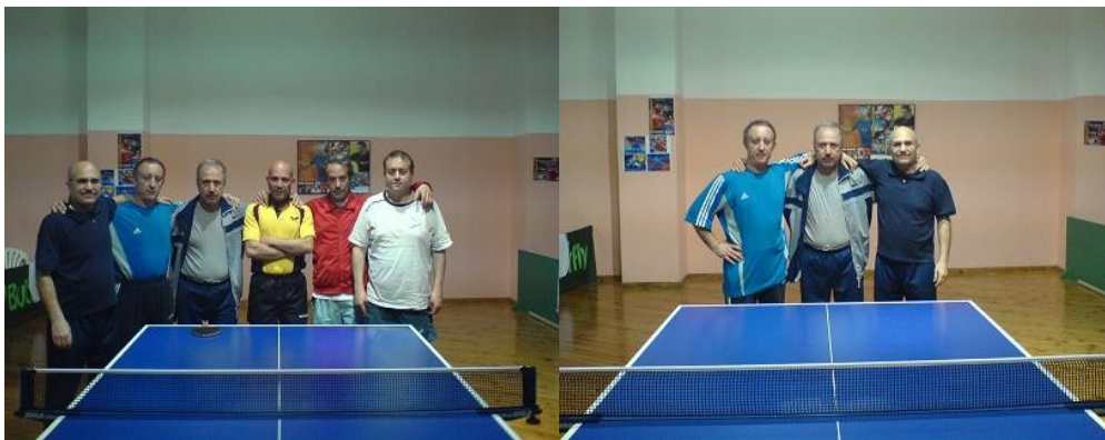
Αναμνηστικές φωτογραφίες από τον αγώνα Αγ.Βαρβ/Πέραμα-Μιλωνάρα 5-4 (28/4/07)